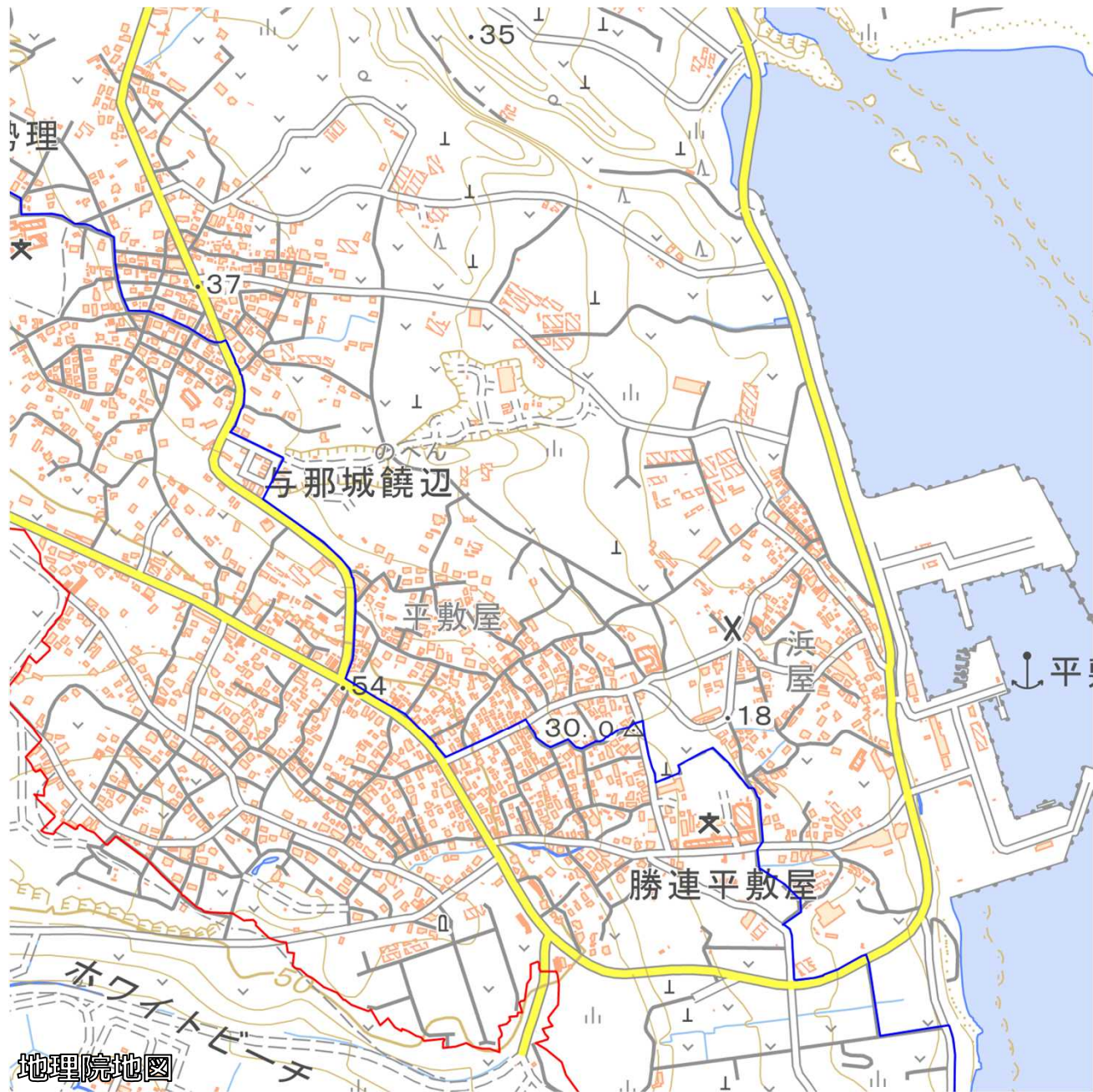
ホワイト・ビーチ地区周辺地域 図②